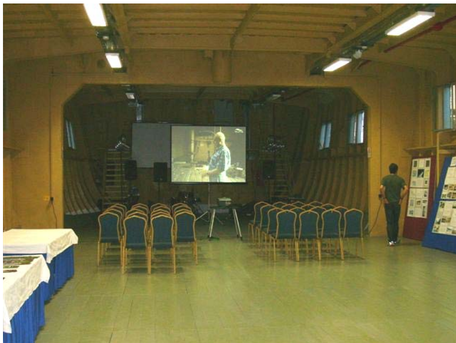
A Debrecen (ex-Kassa) előadója