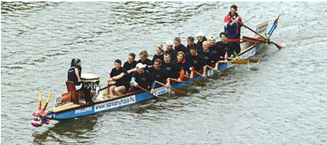
A 20 személyes sárkányhajó