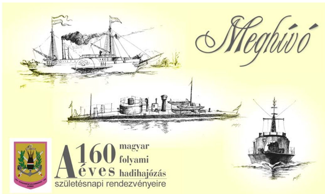
Az elkészült Meghívó

Ennek keretében már elkészítettük a rendezvénysorozat meghívóját és két szakmai előadás anyagát: