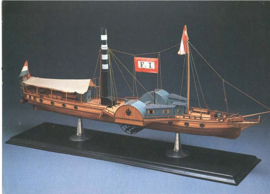
A Franz I. gőzös modellje