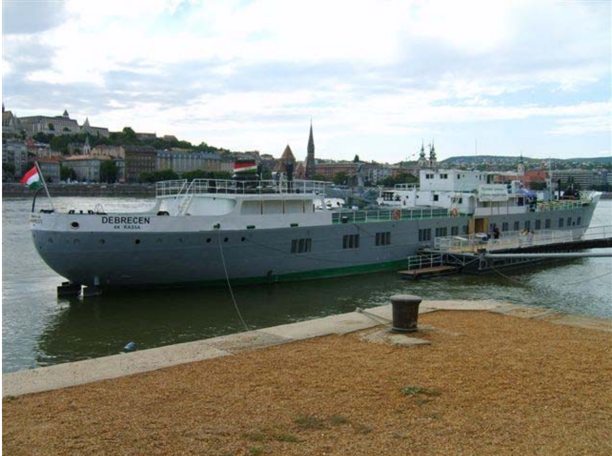
A Debrecen (ex-Kassa) Duna-tengerjáró

A nyílt nap alkalmából a TIT Hajózástörténeti és Hajómodellező Klub kiállítást és előadásokat szervez a Debrecen (ex-Kassa) motoros Duna-tengerjáró hajó fedélzetén az újpesti kikötőben, alacsony vízállás esetén a Szilágyi Dezső téri hajóállomásnál. A kiállítás mellett a parton a hadikikötőben látvány-makettezésre kerül sor.